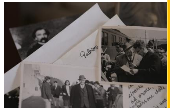
Immagine tratta dalla puntata di Protestantesimo