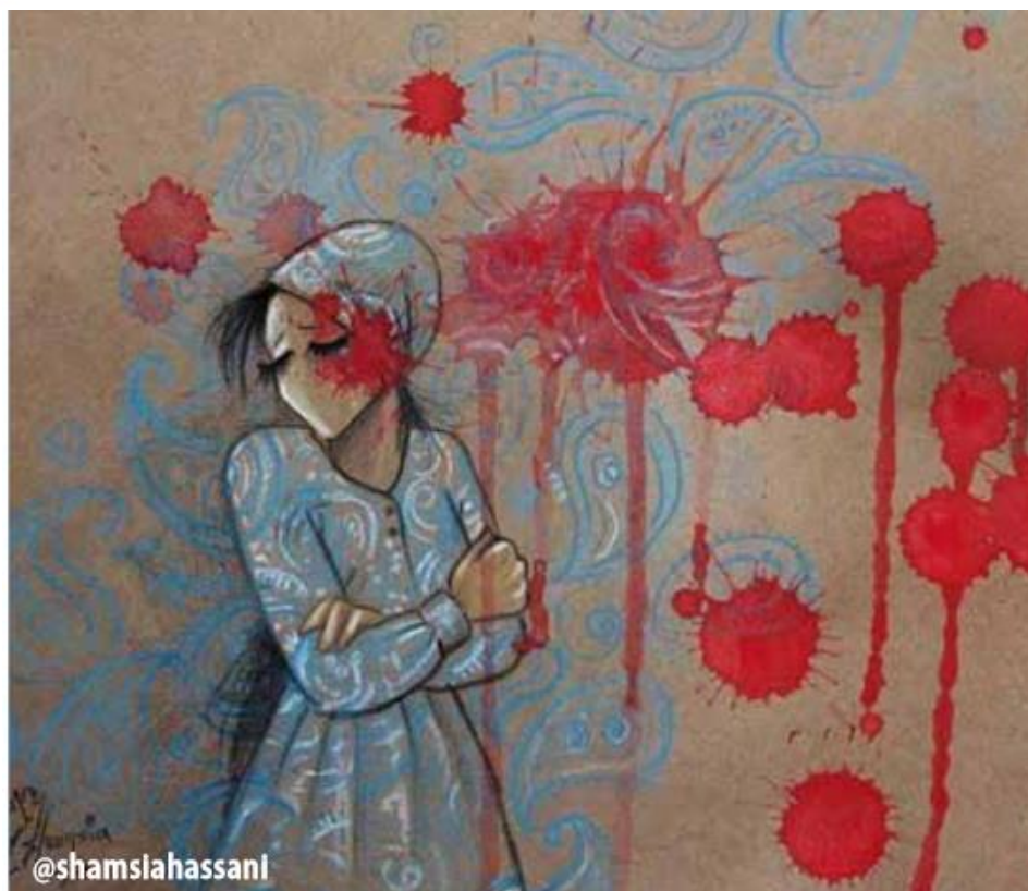
Immagine di Shamsia Hassani, artista afghana. Tratta dal fascicolo FDEI 16 giorni contro la violenza 2022

Roma (NEV), 9 dicembre 2022 – Con oggi, si conclude il ciclo a puntate che ha visto pubblicare, giorno per giorno, gli approfondimenti del fascicolo “16 giorni contro la violenza” curato dalla Federazione delle donne evangeliche in Italia (FDEI). I 16 giorni vanno dal 25 novembre, Giornata internazionale per l’eliminazione della violenza contro le donne, al 10 dicembre, Giornata dei diritti umani. Per rivedere la presentazione ufficiale del fascicolo, clicca qui . Per vedere tutte le puntate, clicca qui .